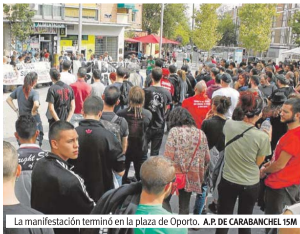
La manifestación terminó en la plaza de Oporto. A.P. DE CARABANCHEL 15M

En contra de las acciones racistas de estos grupos, en nuestro barrio se convocó la ci-