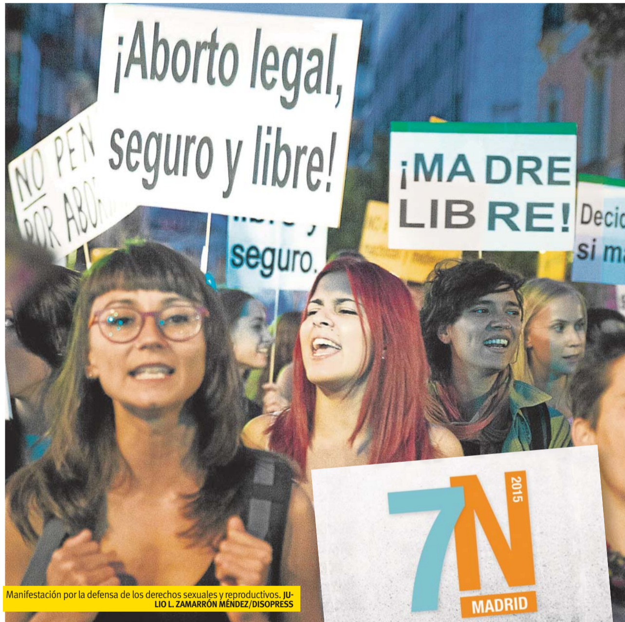
Manifestación por la defensa de los derechos sexuales y reproductivos.

Aproximadamente 400 mujeres al año abortan sin consentimiento paterno/materno. Son