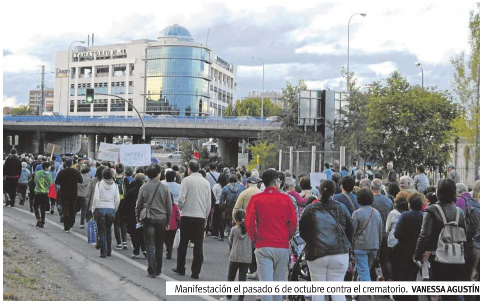
Manifestación el pasado 6 de octubre contra el crematorio. VANESSA AGUSTÍN

Aunque está demostrado que la combustión de los hornos crematorios es altamente tóxica por la emisión de partículas cancerígenas y de mercurio, la legislación es muy laxa a la hora de regularlos. Así, en la Ordenanza General de Protección del Medio Ambiente Urbano solo se le dedica un artículo, el 52.3 del Capítulo II: "Los hornos destinados