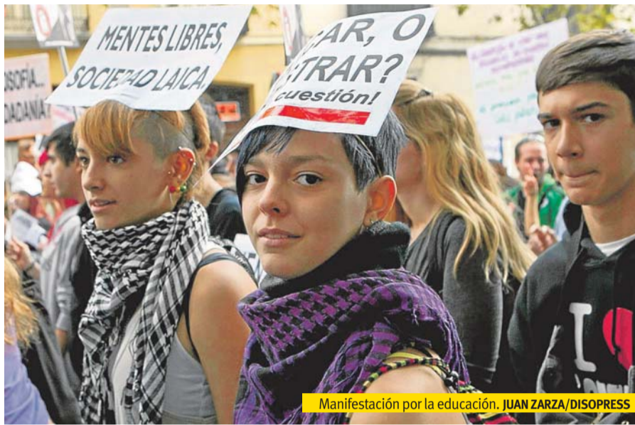
Manifestación por la educación.

Como ejemplo, en la Comunidad de Madrid solo en 2012 eliminaron 200 plazas de profesor, y en este curso los alumnos inscritos en Educación de Adultos han descendido un 31% (unos 20.000) sobre el año anterior, que como cada curso ya tuvo su desorbitada e infame "lista de espera". En los Ciclos Formativos de Formación Profesional cada año se repite un cruel y sospechoso desajuste entre la demanda y la oferta, del que resulta que en unos hay numerosos estudiantes que no pueden estudiar lo que desean