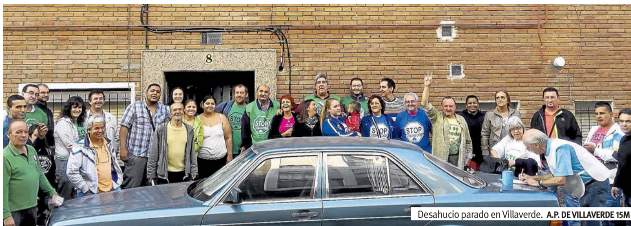
Desahucio parado en Villaverde. A.P. DE VILLAVERDE 15M

Las PAH logran paralizar en un día tres desahucios en Madrid