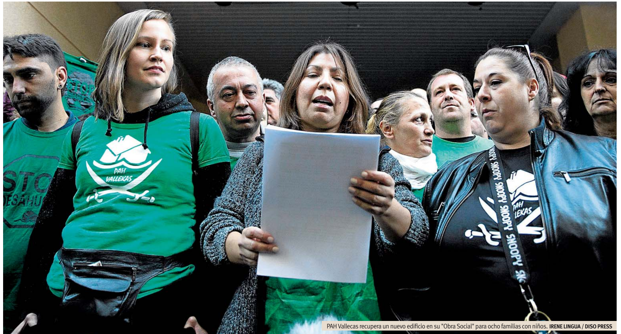
PAH Vallecas recupera un nuevo edificio en su "Obra Social" para ocho familias con niños.

LAS POLÍTICAS DE VIVIENDA EN MADRID SIGUEN SIENDO INSUFICIENTES