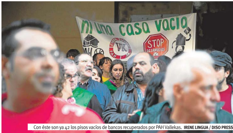
Con éste son ya 42 los pisos vacíos de bancos recuperados por PAH Vallekas.

La tarde del 13 de octubre, ocho familias con 18 menores hacían pública una nueva recuperación de un edificio vacío en Vallekas, en la calle del Monte Perdido. Ocho viviendas que en breve pasarán a ser de SAREB al ser consideradas activos tóxicos . Para nosotras estos activos tóxi-