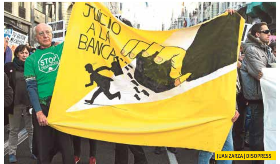
JUAN ZARZA | DISOPRESS

El jueves 6 de octubre, a las 18:00, empieza la concentración delante del Tribunal Supremo en la plaza de la Villa de Paris de Madrid (◀M) Colón), con una manifestación por la mañana siguiente y actividades el sábado 8. El TCJ, la PAH y las asambleas de Vivienda 15M exigirán a los responsables judiciales que se empiece a aplicar la justicia por encima de las consideraciones políticas y económicas. Los responsables de la estafa hipotecaria, que tanto daño han provocado, tienen que devolver lo que han estafado a los afectados y al Estado. Para eso están las leyes, y para eso estaremos nosotros.