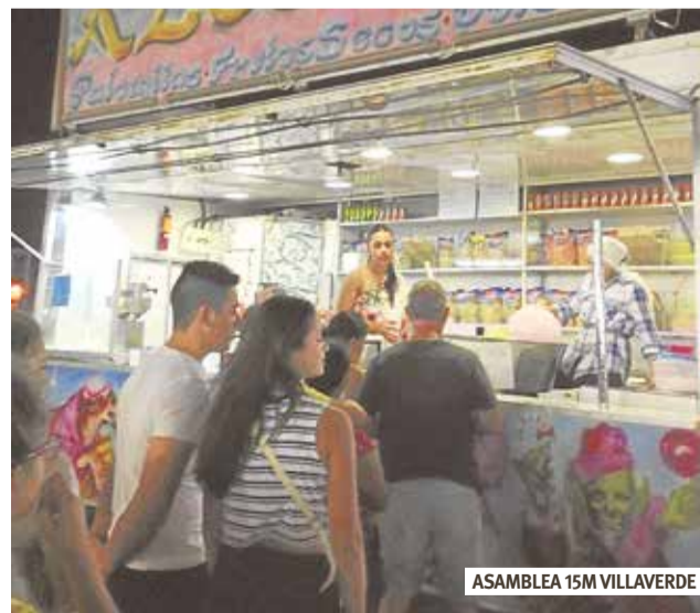
ASAMBLEA 15M VILLAVERDE

Animamos al “Ayuntamiento del Cambio” a que el próximo año zanje definitivamente este asunto, ya que, puestos a sospechar, si nos ponemos a sumar en todos los barrios de Madrid donde se celebran fiestas, los partidos po-