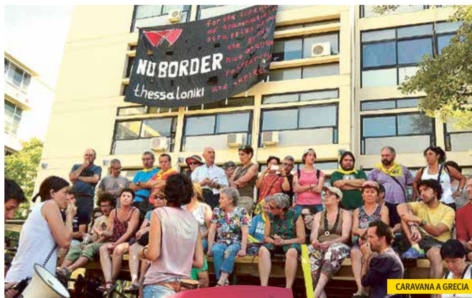
CARAVANA A GRECIA

Esta experiencia se planteó desde un inicio como un punto de partida, una caravana inicial que permitiera conocer diferentes grupos, redes, movimientos, personas que estuvieran trabajando a lo largo y lo ancho del territorio: Salamanca, Valencia, Barcelona, Madrid, Gasteiz, Valladolid, Bilbao, Bizkaia, Navarra, La Rioja,