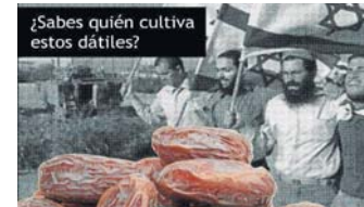
¿Sabes quién cultiva estos dátiles?

Los dátiles israelíes suelen ser de la variedad medjoul , también llamada jumbo , más grandes, oscuros y caros de lo habitual. Israel es el mayor productor mundial de dátiles medjoul , un