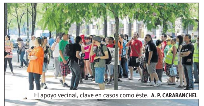
El apoyo vecinal, clave en casos como éste.