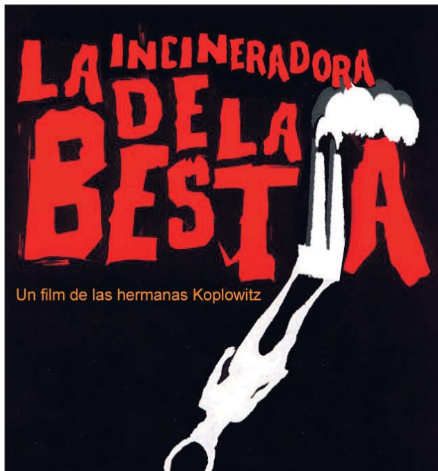
Un film de las hermanas Koplowitz

Podría ser el inicio de una novela negra, pero sucede en la España del 2013, esa España con sello de calidad, con una capital con sueños olímpicos... Pues esa misma capital acaba de autorizar la quema de residuos totalmente reciclables en la Cementera Portland-Valderribas, situada a escasos 2 km de Morata de Tajuña. Una instalación que fue diseñada para fabricar cemento ahora quemará restos de coches, plásticos... y todo tipo de sustancias que, con las técnicas actuales, son totalmente recuperables, aumentando el empleo cualificado en la industria del reciclaje. Y