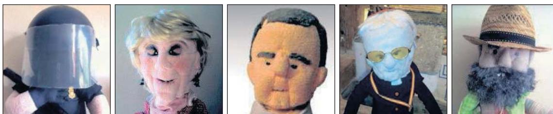
DE IZQUIERDA A DERECHA: AGENTE VELCRO, ESPE, NARCI DE TRAPO, ROUCO FRANELA Y SANCHEZ GORHILO.

guiones, grabar las voces, preparar el vestuario, ensayar y, por supuesto, realizar la función.