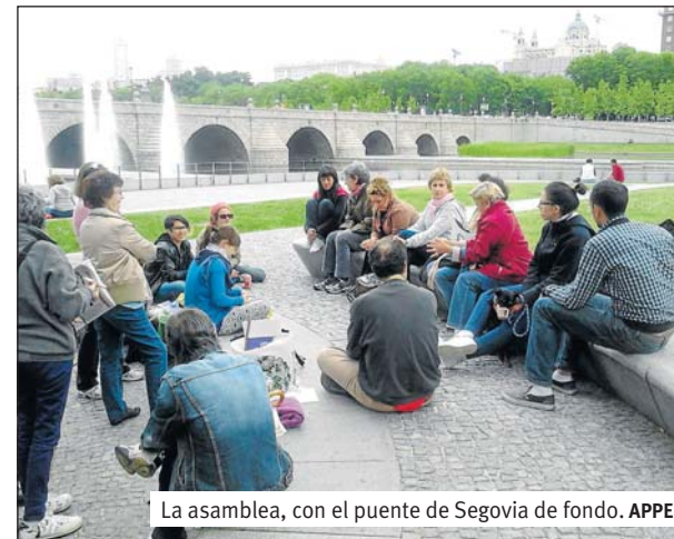
La asamblea, con el puente de Segovia de fondo.

Tratan de remachar aún más la familia tradicional, tan necesaria para el funcionamiento del capitalismo y fuente de privilegios para muchos, cuyo esquema, todavía hegemónico socialmente, es el del varón sustentador de la familia y la mujer, en el mejor de los casos, trabajando la doble jornada, pero siempre madre-cuidadora-ama de casa (y con la pata quebrá).