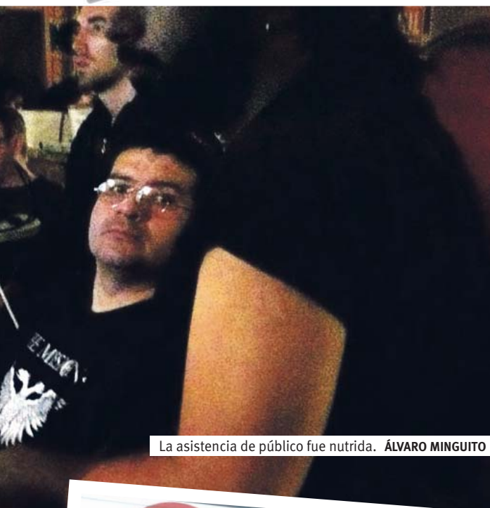
La asistencia de público fue nutrida. ÁLVARO MINGUITO