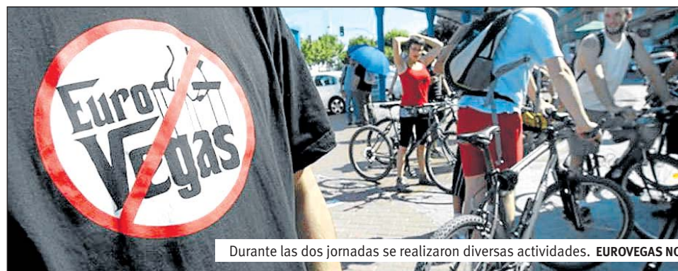
Durante las dos jornadas se realizaron diversas actividades. EUROVEGAS NO

La acampada se desarrolló sin altercados ni presión policial, a excepción del confuso malentendido con un "presunto" propietario que requirió la presencia de las fuerzas del orden (sin dejar muy claro el porqué, al menos a los asistentes), que acudieron solícitas (cuatro coches de policía) y que al constatar que no existía nada que justificase su presencia, abandonaron el lugar de la