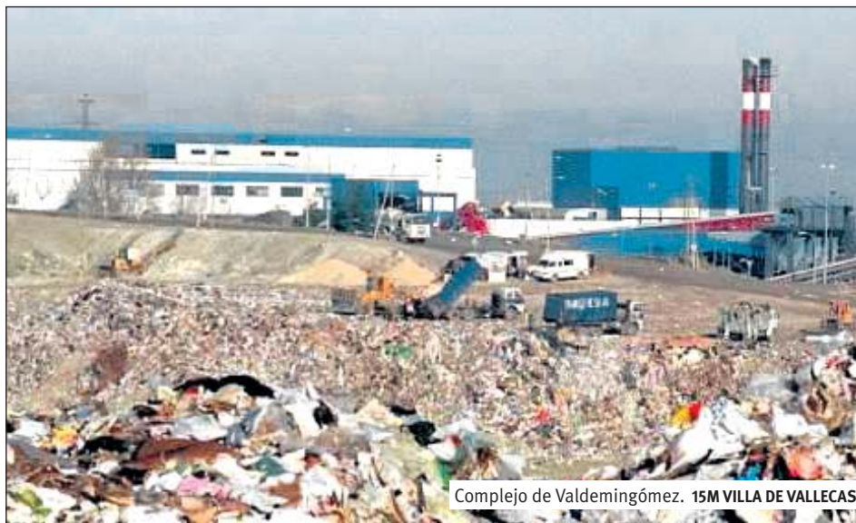
Complejo de Valdemingómez. 15M VILLA DE VALLECAS

— Permitir que el complejo de Valdemingómez esté funcionando sin haberse efectuado la obligatoria Evaluación de Impacto Ambiental, en la que deberían valorarse los riesgos que existen para los ciudadanos que viven en sus alrededores y los impactos en el medio ambiente que producen las emisiones de la incineradora y el complejo en su conjunto.