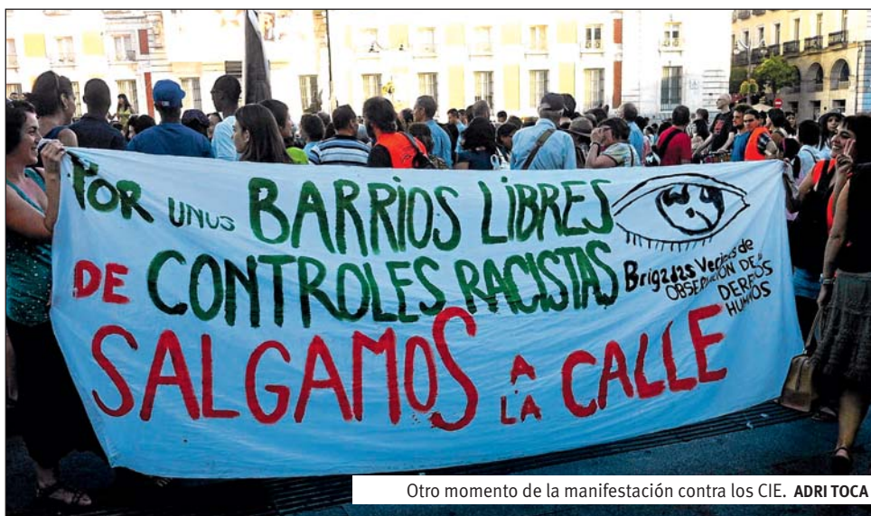
Otro momento de la manifestación contra los CIE. ADRI TOCA

Estos centros fueron creados bajo la premisa de mantener internados a los inmigrantes ilegales mientras se tramitaba su deportación. No obstante, lo que nació como un mero centro de internamiento se convirtió al empezar a funcionar en cárceles de segunda. En España, la ley establece que los extranjeros detenidos sin papeles deben permanecer en el CIE hasta ser devueltos a su país. A los 60 días son expulsados del centro y devueltos a las calles sin ninguna otra repercusión, pero pueden volver a ser internados de nuevo si la policía así