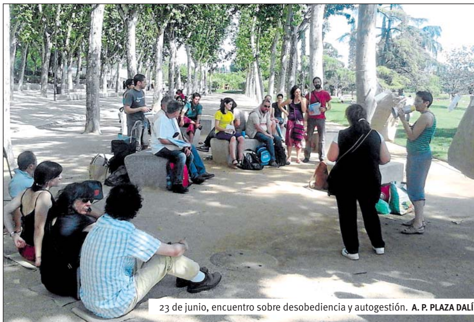
23 de junio, encuentro sobre desobediencia y autogestión. A. P. PLAZA DALÍ.

Desde la Asamblea Popular de Plaza Dalí 15M fuimos con nuestro blog Enredando alternativas ( http://autogestionenred.wordpress.com/ ), que había llamado la atención de varios de los colectivos allí presentes. En este blog aglutina-