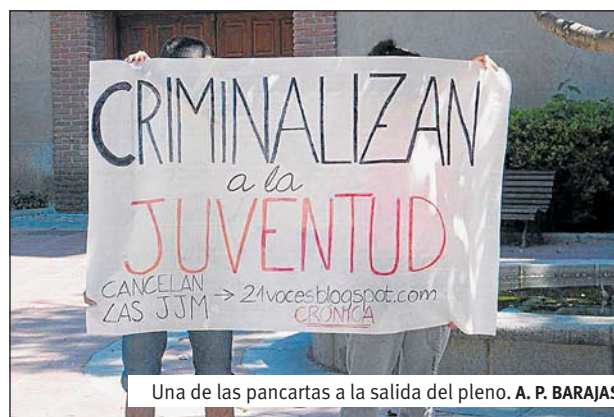
Una de las pancartas a la salida del pleno. A. P. BARAJAS