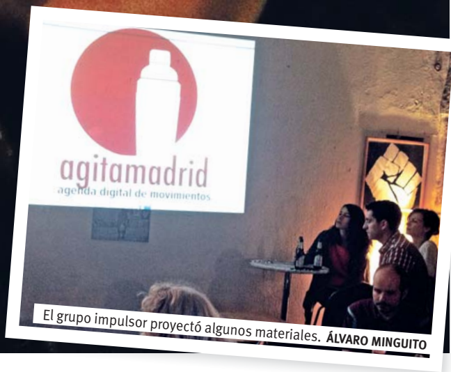
El grupo impulsor proyectó algunos materiales.