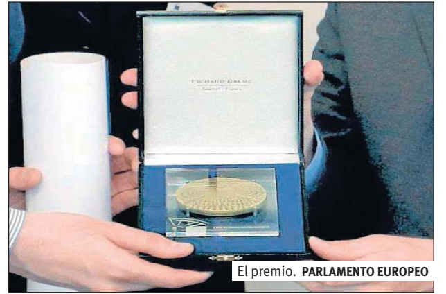
El premio. PARLAMENTO EUROPEO

La Plataforma de Afectados por la Hipoteca ha sido galardonada con el Premio Ciudadano Europeo 2013, que otorga el Parlamento Europeo anualmente. El jurado ha escogido su candidatura junto a otras 41, procedentes de un total de 21 países europeos. El premio se entregará en una ceremonia que se celebrará los días 16 y 17 de octubre en la sede del Parlamento Europeo en Bruselas. La Eurocámara concede el premio Ciudadano Europeo desde 2008 «a personas u organizaciones excepcionales que luchan por los valores europeos, promuevan la integración entre ciudadanos y los Estados miembros o faciliten la cooperación transnacional en el seno de la Unión, y a los que día a día tratan de promover los valores de la Carta