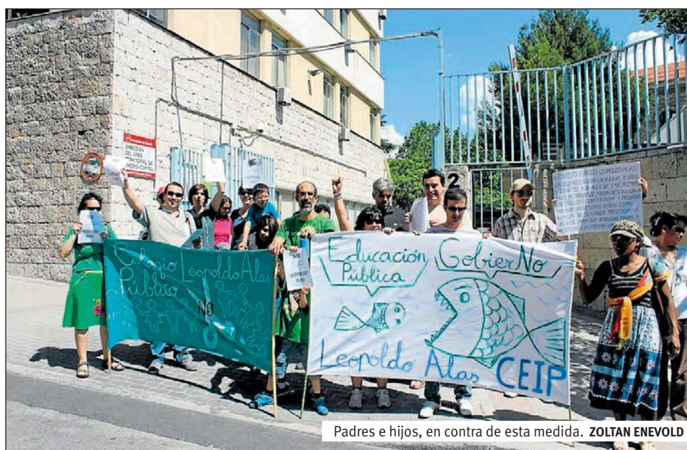
Padres e hijos, en contra de esta medida. ZOLTAN ENEVOLD

Entregan quinientas firmas en contra de la decisión de la Consejería de Educación, Juventud y Deporte de suprimir clases de Infantil y Primaria en su colegio público.