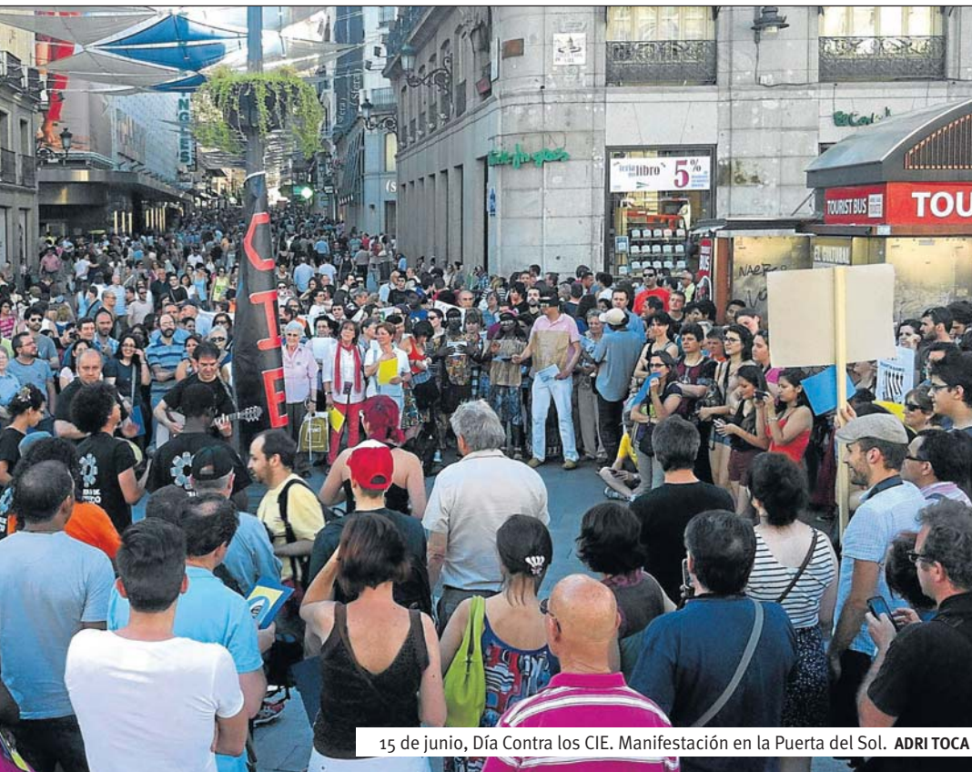
15 de junio, Día Contra los CIE. Manifestación en la Puerta del Sol. ADRI TOCA