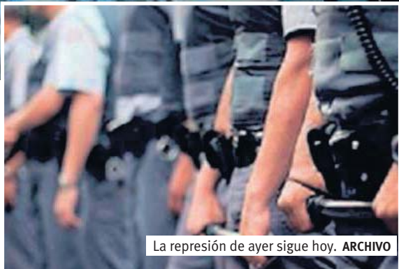
La represión de ayer sigue hoy.

nen sus posiciones formadas: plebiscito y empezar a discutir ya su propia pauta reivindicatoria, 10% del PIB para Educación y otro tanto para Salud.