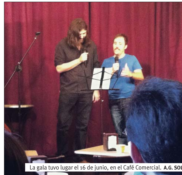
La gala tuvo lugar el 16 de junio, en el Café Comercial.

Pagando facturas a base de risas, y también con la