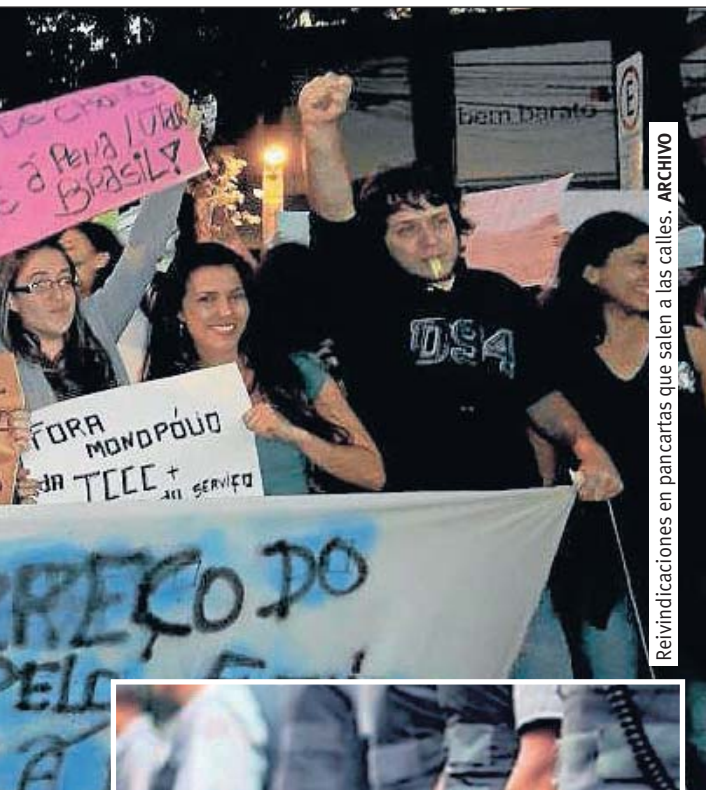
Reivindicaciones en pancartas que salen a las calles.