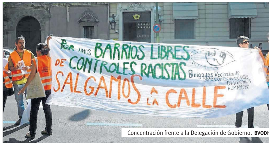
Concentración frente a la Delegación de Gobierno. BVODH

BRIGADAS VECINALES DE OBSERVACIÓN DE DERECHOS HUMANOS