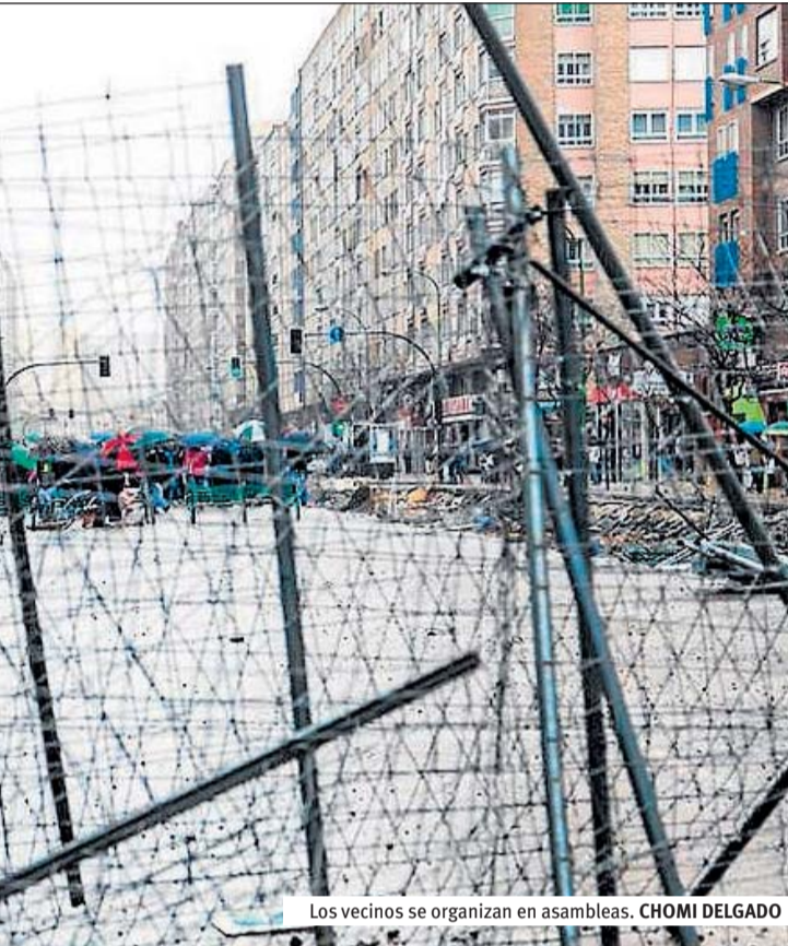
Los vecinos se organizan en asambleas.

do hay calles que no tienen alumbrado público», comenta otro de los vecinos. Aunque desde el Ayuntamiento afirman que el bulevar «mejora la calidad de vida de los vecinos», los manifestan-