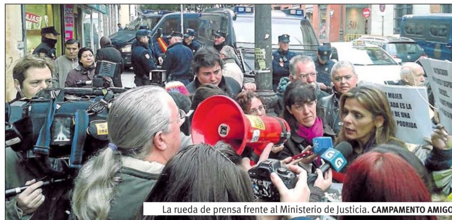
La rueda de prensa frente al Ministerio de Justicia. CAMPAMENTO AMIGO

Las personas sin hogar sufren un rechazo por parte de la población en general e instituciones públicas. Las mujeres sin hogar sufren además una gravísima violencia de género constante, por parte de la población general, pero sobre todo de sus compañeros/amigos/parejas con los que comparten espacios. Sufren continuas violaciones, lo que las deja expuestas a una infección por VIH. Se ven obligadas a realizar determinadas prácticas sexuales para evitar ser golpeadas y no tienen capacidad de decidir sobre su salud. ■