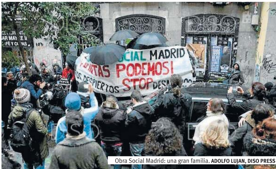
Obra Social Madrid: una gran familia.

Los Gobiernos corruptos, que solo actúan para favorecer a su casta, a la élite económica, han ocultado y falseado el rescate a la banca, endeudando y robando al país. Ahora repiten la jugada por medio del Sareb, que promueve la re-venta de vivienda a precios pactados con bancos e inmobiliarias en su beneficio y en detrimento del pueblo que no lo puede ni debe pagar. La actuación de los Gobiernos en España es una regresión al feudalismo sádico, además de una miopía ignorante e incompetente, repitiendo el método capitalista de crear las desigualdades y precariedades más obscenas,