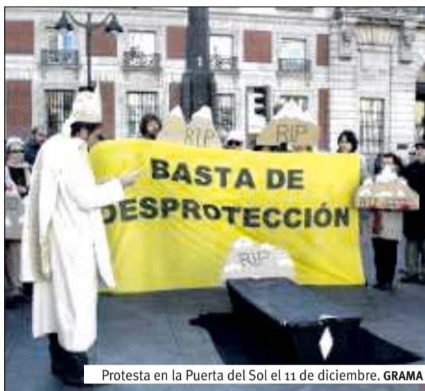
Protesta en la Puerta del Sol el 11 de diciembre.

En el año 2013 se ha modificado la normativa ambiental que afecta a los espacios protegidos en el territorio de la CAM. En su articulado, se deroga la ley de declaración del Parque Natural de la Cumbre, Circo y Lagunas de Peñalara y se modifican los límites del Parque Regional de la Cuenca Alta del Manzanares. Eran los espacios protegidos más antiguos y con una normativa más proteccionista. También se ha aprobado