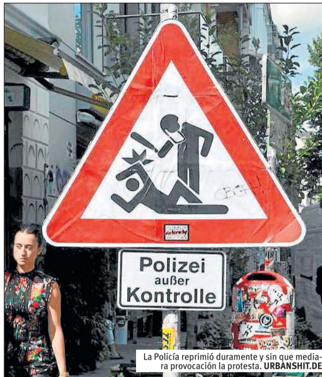
La Policía reprimió duramente y sin que mediara provocación la protesta.

Por otro lado, desde octubre de 2013 se están llevando a cabo redadas racistas por parte de la Policía con el fin de perseguir y deportar a migrantes, muchos de los cuales se han organizado en el grupo "Lampedusa en Hamburgo" y son parte de los 5.700 refugiados expulsados de Italia en marzo de 2013. Sus protestas se han sumado a la campaña contra los desalojos sin previo aviso de las viviendas "Esso-Häuser" y la creciente gentrificación que impide el acceso a vivienda digna en el centro de la ciudad a personas con menores ingresos, como es-