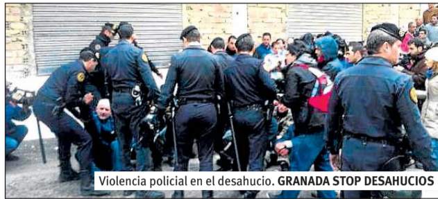
Violencia policial en el desahucio. GRANADA STOP DESAHUCIOS

Ante la negativa de los asistentes a que se arrebatara su vivienda a estas familias, Guardia Civil y Policía Nacional han ido, uno por uno, expulsando por la fuerza a todas las personas presentes y ha procedido a efectuar el desahucio. Tres miembros del grupo Stop Desahucios del 15M de Granada han sido retenidos e identificados, una compañera ha sufrido un ataque de ansiedad y otra ha tenido que recibir asis-