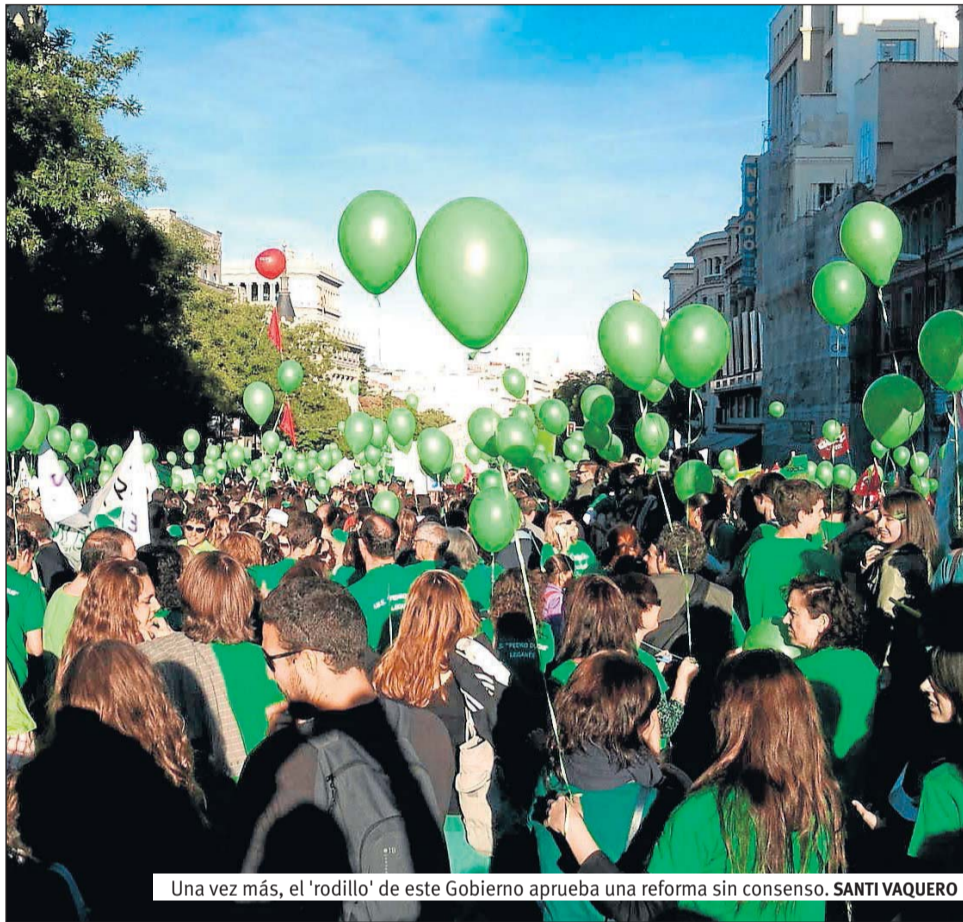
Una vez más, el 'rodillo' de este Gobierno aprueba una reforma sin consenso. SANTI VAQUERO

EDUCACIÓN 15M SOL a LOMCE, desde el principio, deja claro que sirve a un fin que está por encima de cualquier otra premisa: educar para el mercado con las reglas del mercado. Reglas que son las que tenemos que interiorizar para competir: hemos pasado de aprender para "ser" personas a aprender para "estar" compitiendo. Educa para una sociedad de mercado de corte neoliberal sin cuestionar la validez social de este modelo económico. Promueve un sistema educativo que no es garante de la cultura, supeditado a otros fines.