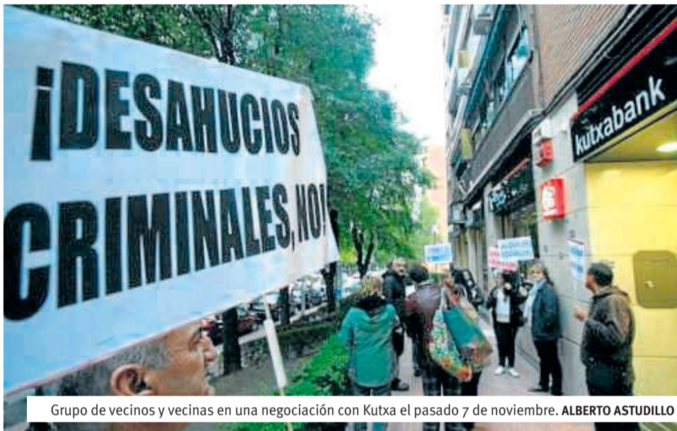
Grupo de vecinos y vecinas en una negociación con Kutxa el pasado 7 de noviembre. ALBERTO ASTUDILLO