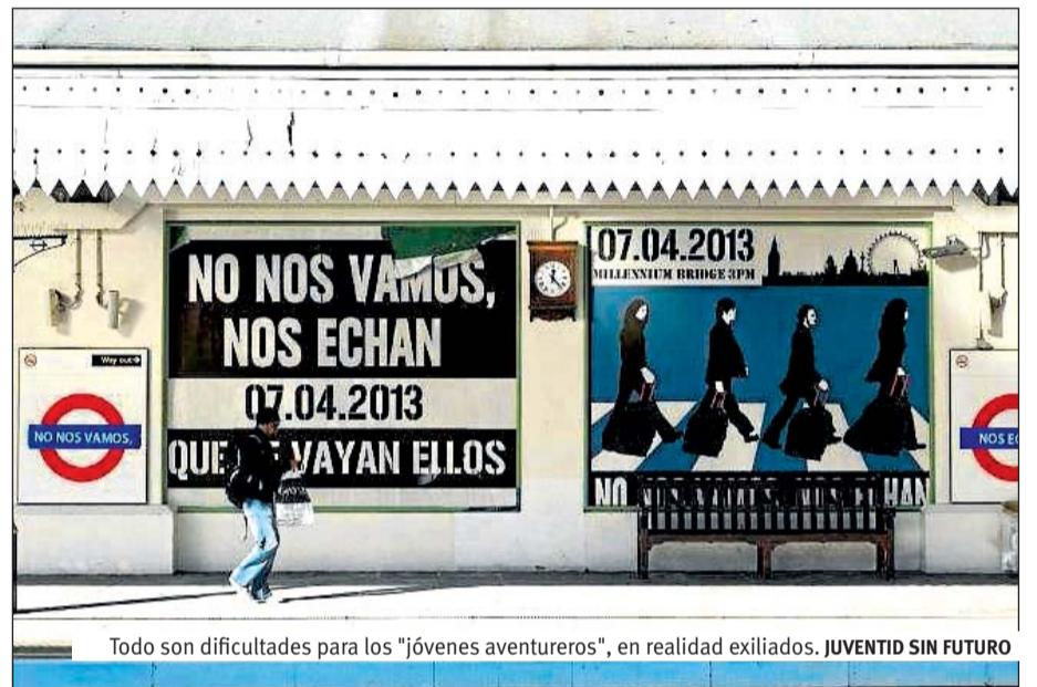
Todo son dificultades para los "jóvenes aventureros", en realidad exiliados. JUVENTUD SIN FUTURO