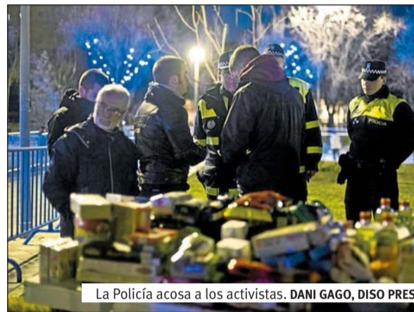
La Policía acosa a los activistas.

pantes de Distrito 14, ha explicado: «Les hemos dicho que, si querían llevarse a alguno, tendría que ser a todos, puesto que todos estamos participando». Ante esta situación y tras varios minutos de diálogo con la Policía, los agentes han tomado los nombres y direcciones de dos jóvenes y les han dejado proseguir con la recogida de alimentos. Poco después, han tenido conocimiento de que varios agentes habían acudido a sus