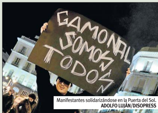
Manifestantes solidarizándose en la Puerta del Sol. ADOLFO LUJÁN/DISOPRESS

DISOPRESS Cerca de 3.000 manifestantes se concentraron, en la tarde del día 15, en la Puerta del Sol para expresar su apoyo a la lucha del barrio burgalés de Gamonal. Al grito de «antidisturbios, fuera de Burgos» o «todos somos Gamonal», comenzaron una marcha que continuó por la Gran Vía.