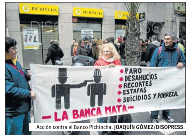
Acción contra el Banco Pichincha.

CAMPAMENTO AMIGO 15M El jueves 2 de enero tuvo lugar una acción contra el Banco Pichincha impulsada por colectivos #StopDesahucios de Madrid y Alicante. Alrededor de cien personas en Alicante y otras treinta en Madrid se concentraron a las puertas de las sucursales de la entidad para exigir la dación en pago para Carlos, un ciudadano con nacionalidad española, cuya hipoteca fue adquirida por el Banco Pichincha. Esta entidad, de capital ecuatoriano, pero constituida como empresa española en este país, actúa como «banco buitre» comprando paquetes de deuda a entidades españolas para después exigir el pago y perseguir a los deudores, incluso cuando estos se encuentran en riesgo de exclusión social. En este sentido, Pichincha no cumple con la Ley 1/2013 de 14 de mayo, que establece algunas medidas mínimas de protección de los deudores hipotecarios, como la dación en pago para las personas en situación de mayor vulnerabilidad.