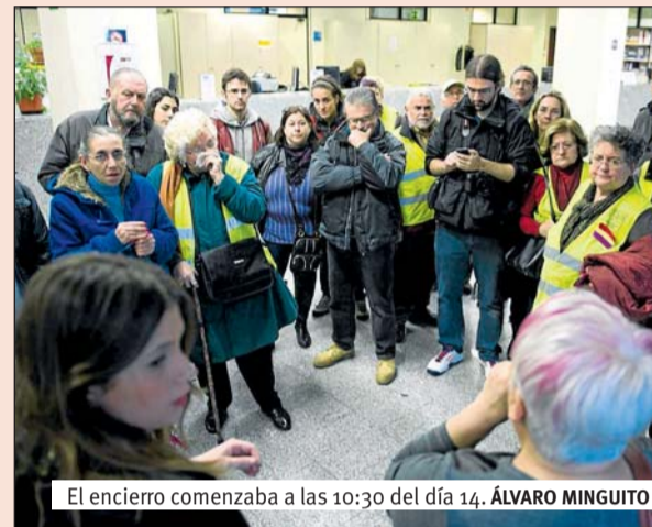
El encierro comenzaba a las 10:30 del día 14.