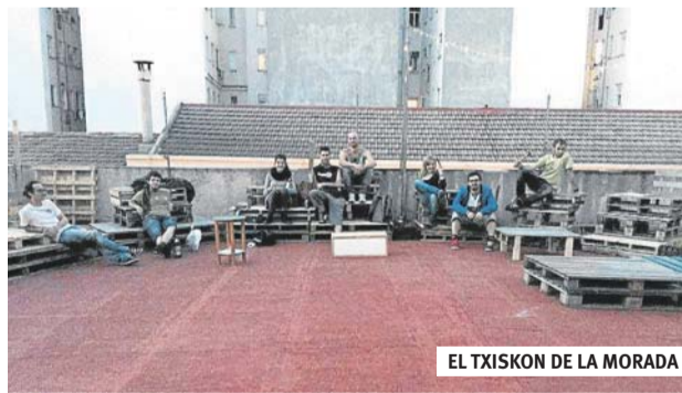
EL TXISKON DE LA MORADA

Es por esto que hemos decidido montar un espacio libre y autogestionado en el que poder acceder a la cultura de forma gratuita en la azotea del CSOA La Morada. Contaremos