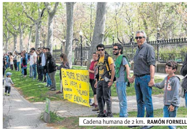
Cadena humana de 2 km.

Uno de los bloques se encargó de cubrir el tramo de la calle Pujades, otros dos grupos dibujaron la cadena en la calle Wellington y el paseo Picasso, y un último bloque se desplazó a lo largo del paseo de Circumval·lació. Gente de todas las edades, muchas criaturas y muchas reivindicaciones con el predominio del color amarillo. La camiseta contra los recortes en la educación —también amarilla— tuvo tanta presencia como las que se han elaborado especialmente para hacer la acción de la cadena humana.