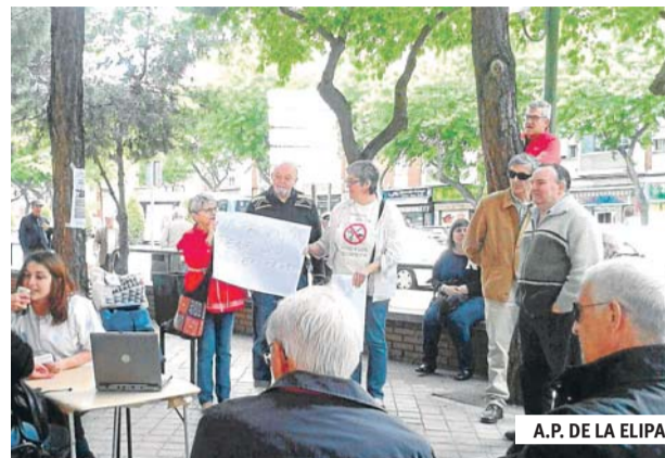
A.P. DE LA ELIPA

A continuación se presentó una charla-debate sobre la situación de la sanidad pública en Madrid, analizando el estado en que se encuentra la Atención Primaria y Hospitalaria o Especializada, los problemas existentes, así como sus causas y sus posibles soluciones. Por último, se abrió un turno de intervenciones en el que hubo gran participación.