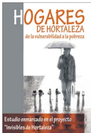
Estudio enmarcado en el proyecto "Invisibles de Hortaleza"

— El 28,8% no puede permitirse asistir una vez al mes