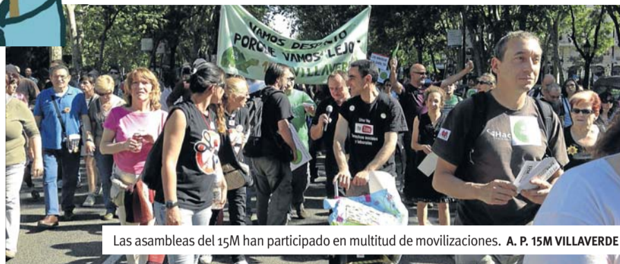
Las asambleas del 15M han participado en multitud de movilizaciones. A. P. 15M VILLAVEVERDE

diendo en nuestro panorama político y ante las múltiples elecciones electorales que se avecinan, es cuando más hay que preservar el espíritu del movimiento 15M y no escuchar los cantos de sirena que pretenden apropiarse del movimiento y que aspiren a cambiar todo para seguir igual. Es fundamental mantener el espíritu del 15M hoy más que nunca y dejar claro que la lucha y el cambio vendrá de las calles o no vendrá. ■