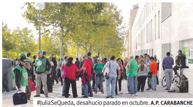
#JuliaSeQueda, desahucio parado en octubre. A.P. CARABANCHEL

El vecindario practica el apoyo mutuo y la solidaridad para sobrepasar la miseria más absoluta