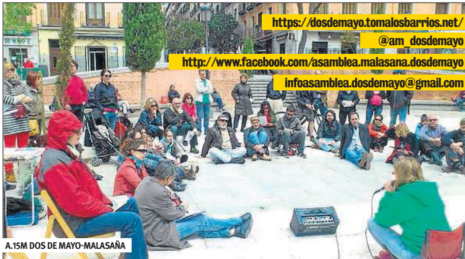
A.15M DOS DE MAYO-MALASAÑA

Igual que las demás asambleas que surgieron del 15M, la nuestra fue el fruto de cantidad de personas y personalidades que la bañaron con ricos debates, ideas a millares y un gran imaginario colectivo. El tiempo pasa y el camino es largo. Y aunque el nú-