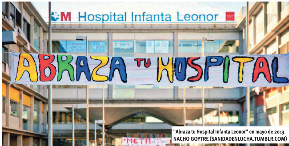
"Abraza tu Hospital Infanta Leonor" en mayo de 2013.

La Marea Blanca, convocada por la Medsap (Mesa en Defensa de la Sanidad Pública de Madrid) desde el 2012, sale a la calle los terceros domingos de mes en Madrid a denunciar el desmantelamiento y privatización de nuestra sanidad pública. La Marea Blanca, además de las manifestaciones/concentraciones en el Ministerio de Sanidad, este año 2017 está acudiendo a los barrios a denunciar situaciones concretas de falta de recursos, de atención, de mantenimiento e intentos de desmantelar servicios sanitarios en los hospitales públicos. Ya ha acudido al Ramón y Cajal, Gregorio Marañón, La Princesa y el Hospital de Móstoles.