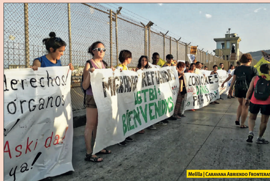
Melilla | CARAVANA ABRIENDO FRONTERAS

En Melilla pudimos compartir nuestro tiempo con algunos de los niños que malviven en la calle (hay cerca de 500 menores no acompañados —MENA— en la ciudad, de los cuales unas decenas viven en la calle), niños que viven de espaldas a las Administraciones, hasta el punto de que la asistencia sanitaria se les niega, un problema que algunas de nuestras compañeras pudieron enfrentar haciendo acompañamientos médicos. Conocimos las terribles condiciones en las que trabajan las porteadoras, mujeres que cargan enormes fardos de mercancías sobre sus espaldas de un lado a otro de la frontera y que soportan cada día no solo ese peso, sino también la violencia policial, los aplastamientos en el paso fronterizo y el ago-