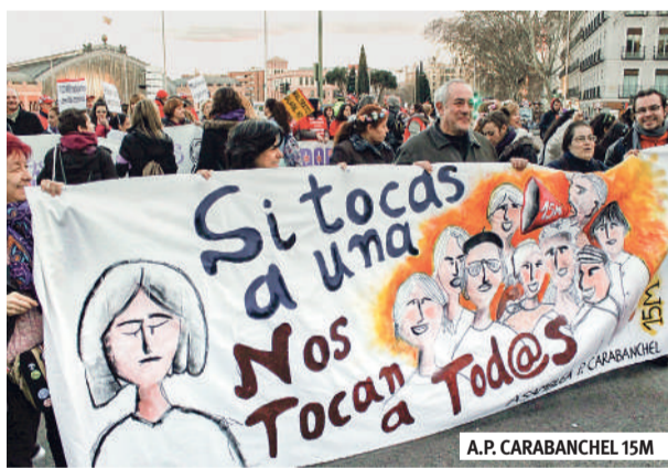
A.P. CARABANCHEL 15M