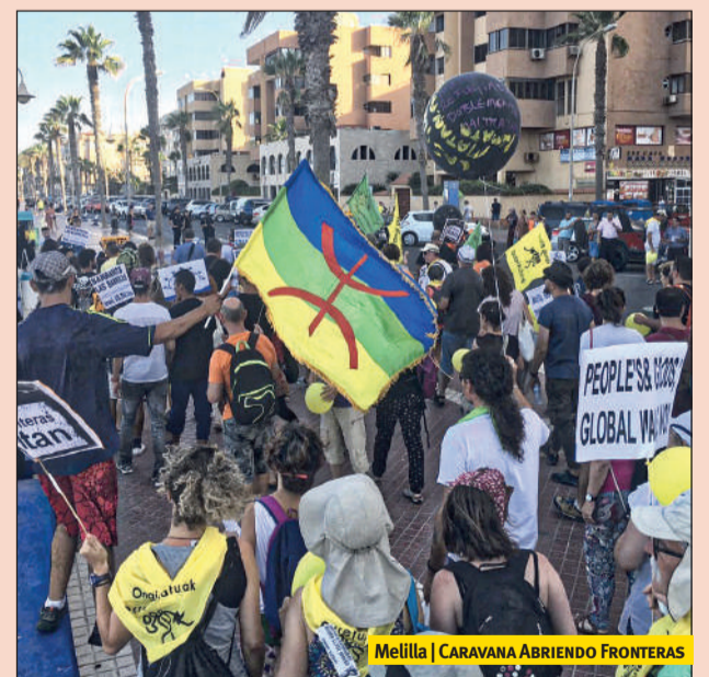
Melilla | CARAVANA ABRIENDO FRONTERAS

La Caravana Abriendo Fronteras viajó este verano a