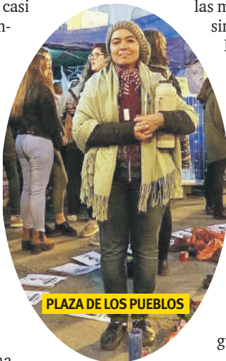
PLAZA DE LOS PUEBLOS

“[...]Tengo hígado, estómago, dos ovarios, / una matriz, corazón y cerebro, más accesorios. / Todo funciona en orden, por lo tanto, / río, grito, insulto, lloro y hago el amor. / Y después lo cuento”. ■