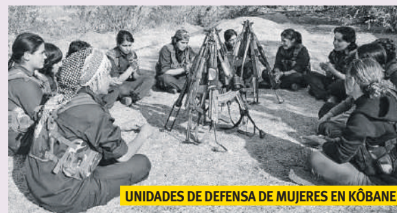
UNIDADES DE DEFENSA DE MUJERES EN KÔBANE

Extracto de artículo de l'altaveu del Poble Sec